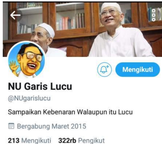
Gambar 1. Foto Profil NU Garis Lucu di Twitter

mengisi di sebuah Gereja. pemilihan NU Garis Lucu yang menjadikan ikon Gus Dur sangat tepat sekali dengan tweet yang humoris sekaligus toleran mampu menumbuhkan kembali nilai-nilai Gus Dur sebagai tokoh yang pluralisme dan penuh humoris dalam beragama.